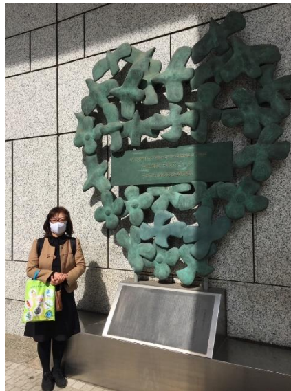
都庁の都民広場にある「都民平和アピール」